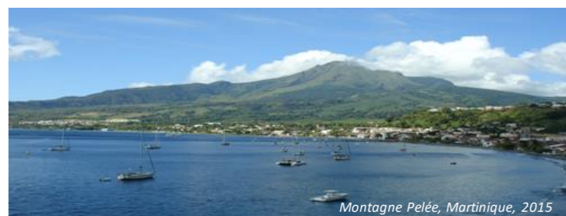
Montagne Pelée, Martinique, 2015